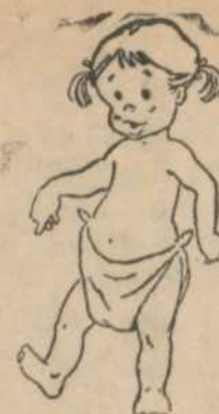
Houtmarkt 77, ZUTPHEN Telefoon 3539

voor alle doeleinden, voor half een gemaakt, dezelfde dag nog klaar.